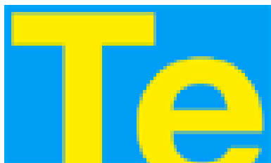
JPEG-Datei ohne Komprimierung

Wenn Sie Ihre Anzeige selbst gestalten, so senden Sie uns diese bitte als JPEG-, TIFF- oder EPS-Datei. JPEG-Dateien bitte nicht zu stark komprimieren, sondern in hoher Qualität senden (siehe Abbildungen). Word-Dokumente mit Fotos können wir nicht für das Layout der Zeitschrift verwenden. Bitte Word-Dateien nur bei reinen Textanzeigen zusenden. Fotos bitte separat zusenden.