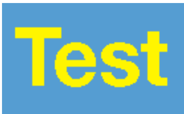
72 dpi Auflösung

Falls Sie Ihre Anzeige selbst gestalten und uns als Datei zusenden, sollten Sie diese sogar in 600 dpi anlegen.