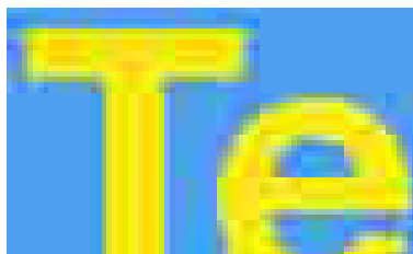
JPEG-Datei mit hoher Komprimierung