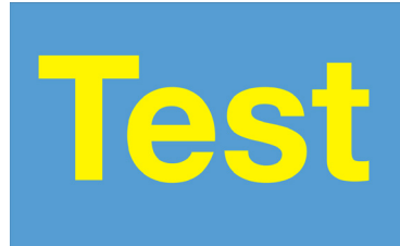
600 dpi Auflösung

Bitte beachten Sie auch die Anzeigengrößen und berücksichtigen diese bei der Textmenge. Zu viel Text in z. B. einer Anzeige von 1/8-Seite Größe ist nicht verkaufsfördernd. Einige Beispiele sind nachfolgend abgebildet.